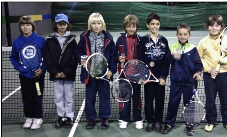
GRUPO SUB-10 MASCULINO